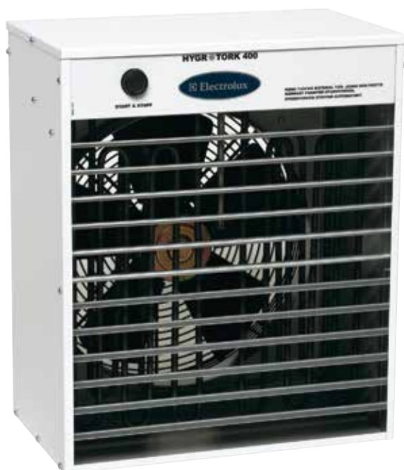
HT 400 E art. nr. 988700310