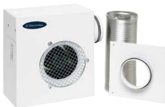
Takfläkt art. nr. 988700313